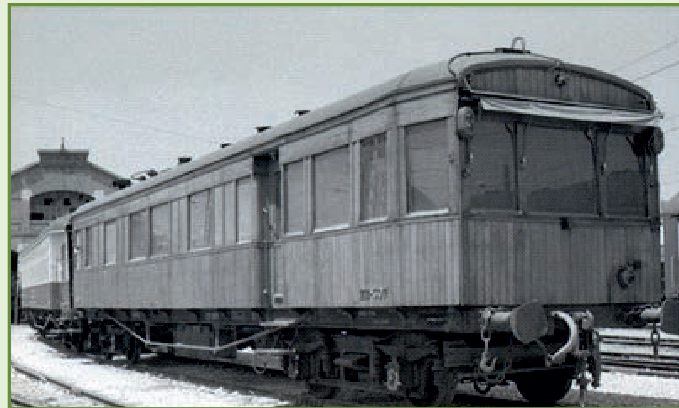
Exhibit IG 170

In 1987, it was removed from RENFE’s rolling stock and taken to the Museum, where it was restored and has been on display since then.