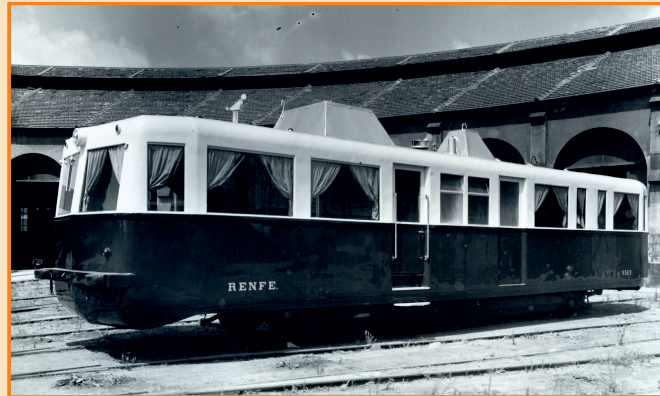
Exhibit IG 112

Between 1984 and 1988, having been assigned to the Museum, it made several journeys along railway lines that were about to be closed in order to take possession of heritage items.